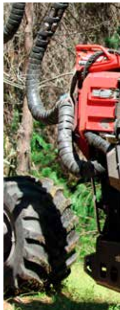
El Komatsu S172.