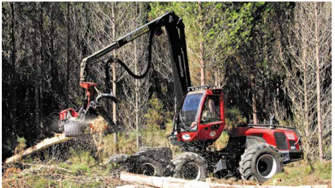
Es una procesadora ágil y rápida.