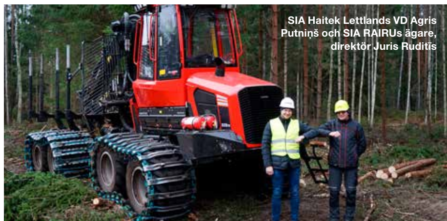
SIA Haitek Lettlands VD Agris Putniņš och SIA RAIURU's ägare, direktör Juris Rudītis

Las máquinas actuales son un 15 % más productivas que los modelos anterior-